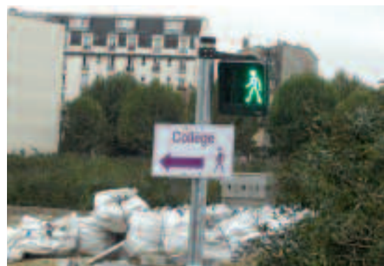
Sur le chemin de l'école, sans commentaires...

Ce quartier compte aujourd'hui une population de près de 7 000 habitants, qui ne disposent pas