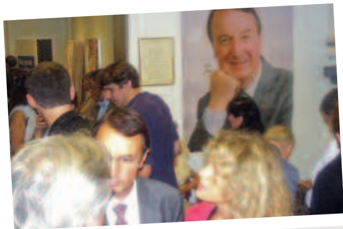
Septembre 2006, réunion de rentrée à l'UMP Clichy